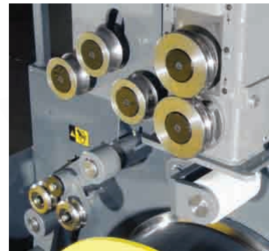
空圧式自動コイル端末検知ローラー、動力式送りヘッド、およびワイヤローラー

モデル100 | オプションのペンダント操作盤を搭載した機械の安全カバーが開いた状態を示しています。