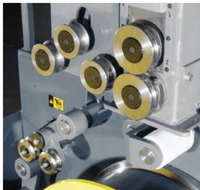
Pneumatische, automatische Drahtbundendrolle; Vorschubkopf und Drahtrollen motorbetrieben

Abgebildet mit offener Schutztür und freihängender Bedienstation